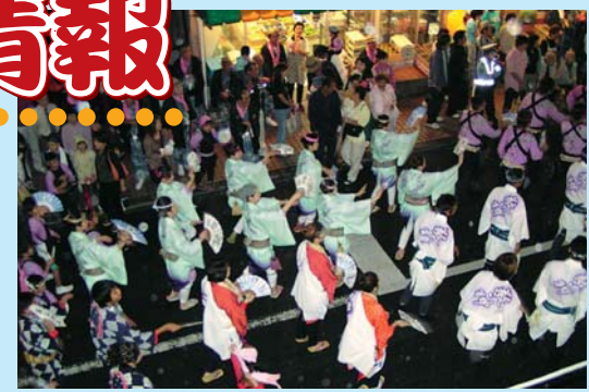
●総踊り 9月1日 18:00~

● 役曳き山車順路 9/2 13:40~17:00 ● 大提灯奉納コース 9/1